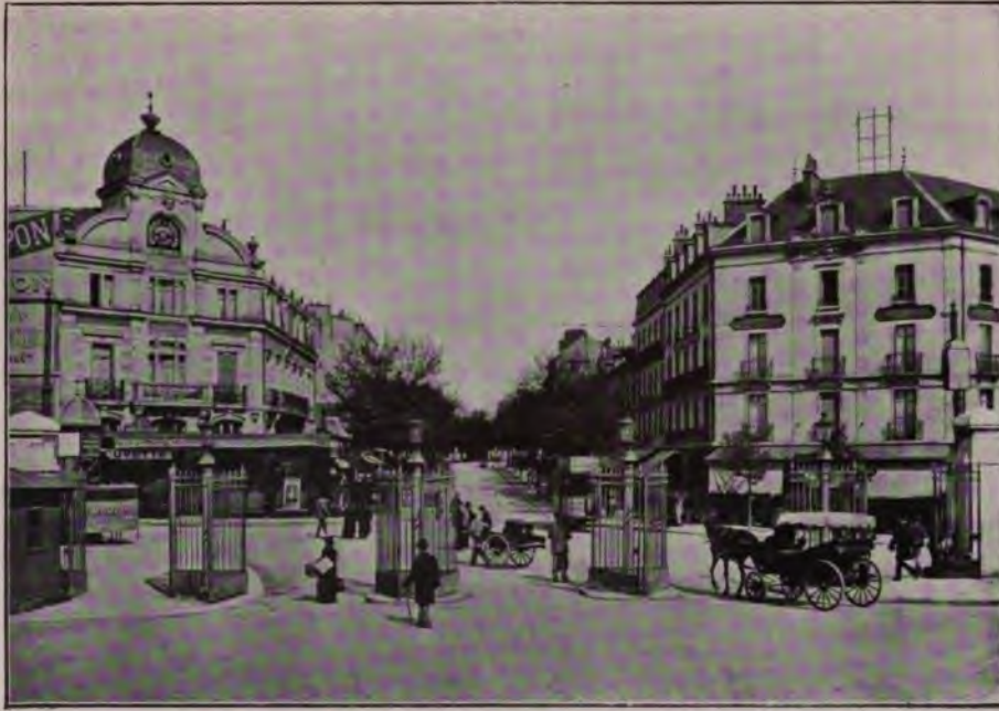
Rue de la Gare.